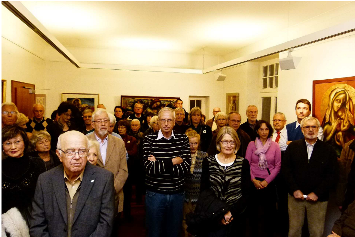
Dicht gedrängt standen die zahlreichen Besucher der Ausstellung.